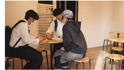
《調査結果の集計・分析》