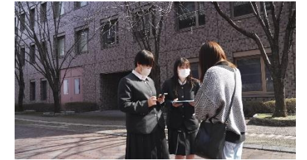
《メタバース新事業考案》